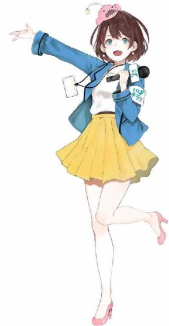
茨 ひより (茨城県公認Vtuber)